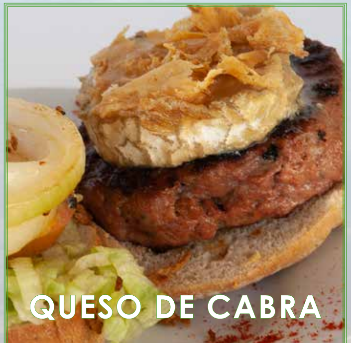
QUESO DE CABRA